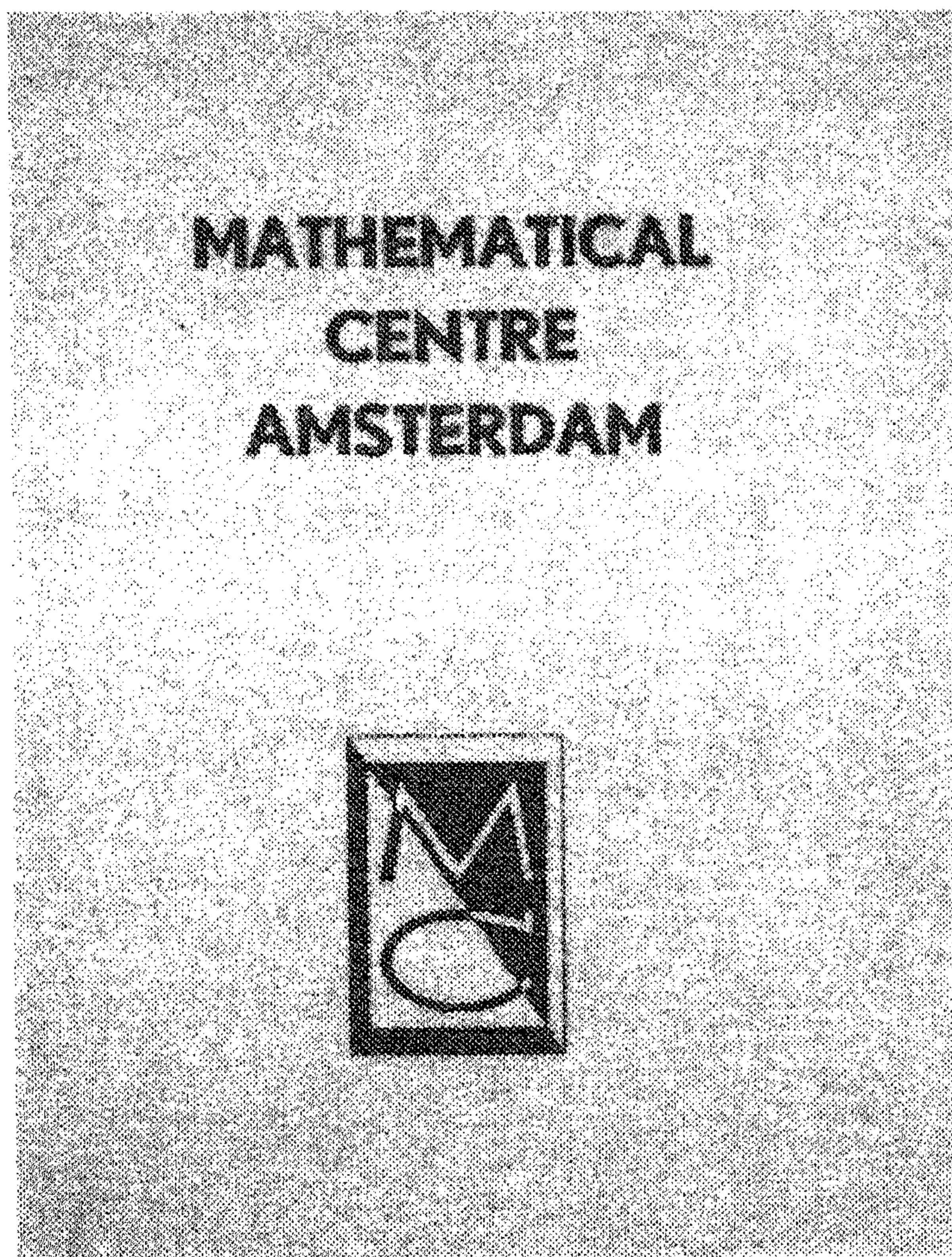
. . . . en tweede (1954) Engelstalige brochure.